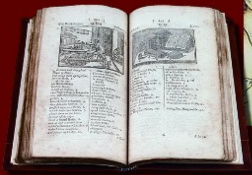
左：コメニウス作「世界図説」1777年イギリス版（1658年初版） 右：レズリー・ブルック「カラスのジョニーのパーティー」©1907 LLeslie Brooke